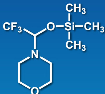
4-[2,2,2-Trifluoro-1-[(trimethylsilyl)oxy]ethyl]morpholine 1g 8,300円 / 5g 29,100円 [T3597]