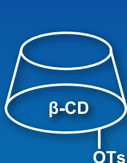
Mono-2-O-(p-toluenesulfonyl)- \beta -cyclodextrin 200mg / 1g [M1741]